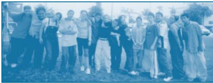
Miembros del grupo de ritos de iniciación de la Universidad Barry posan para una foto.

Since 1994, Barry University has worked to build community outreach activities into its educational program. Six graduate