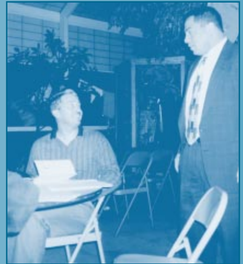
El Colegio Comunitario de Northern Essex trabaja con empresarios incipientes.

Centros de servicio. Dos recipientes de asistencia de HSIAC están usando fondos de subsidios para ofrecer una variedad de servicios a todos los sectores de un barrio en una ubicación central. Un Centro Tecnológico Comunitario construido por el Colegio Comunitario Passaic contará con un laboratorio de medios múltiples y