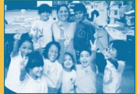
Miembros del grupo de aumento del alfabetismo de la Universidad Barry sonríen para la posteridad.